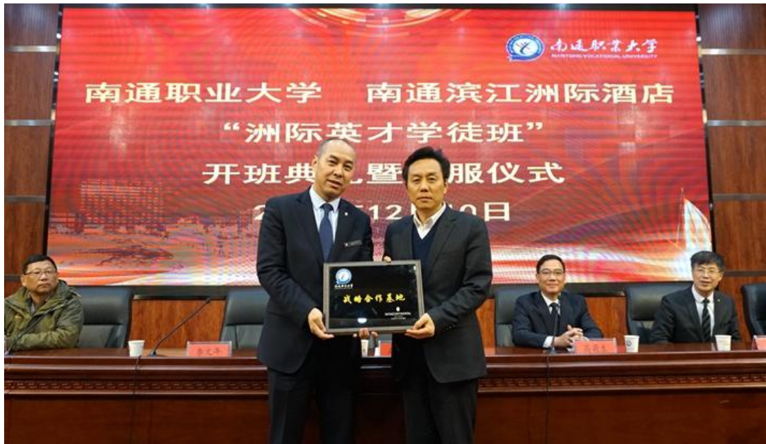
滨江洲际酒店与南通职业大学 战略合作基地揭牌