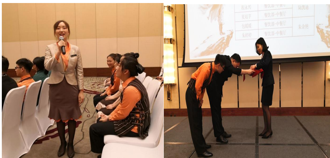
图 8 拜师仪式现场