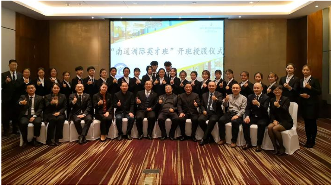
“洲际英才班”授服仪式双方合影留念