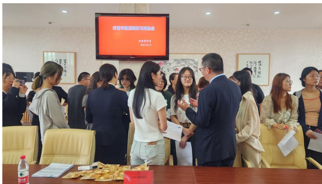
滨江洲际受邀参加学院旅游管理教研室举办的 2024 届岗位实习双选会

这种人才培养模式，既遵循了循序渐进的一般教育规律，又符合酒店高职教育实践性强的特点，学生毕业后能“无障碍”地进入岗位角色。