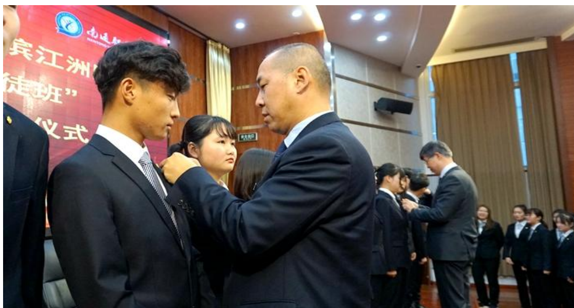
滨江洲际酒店领导给学生授服

南通滨江洲际酒店每年为学徒班学员捐赠服装，并举行授服仪式，设立“南通洲际英才”实习成长基金，作为资助来酒店实习就业“英才”学生的专项奖励基金。