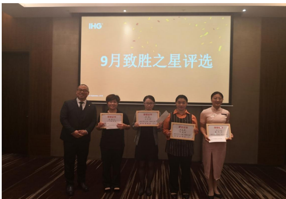
学徒班学生在实习期间被评为“致胜之星”

学生（学徒）的学习环境是真实的服务场所，学生可以直接看到工作人员的活动并参与不同岗位的专业性目标技能，职业能力得以大幅提高，职业素质得以初步形成，解决了学生在学习中理论与实践脱节的问题，锻炼了学生的社会适应性，也减轻了学生上学期间经济负担减轻。现代学徒制试点班多名学徒在实习期间被评为酒店优秀员工和见习领班。