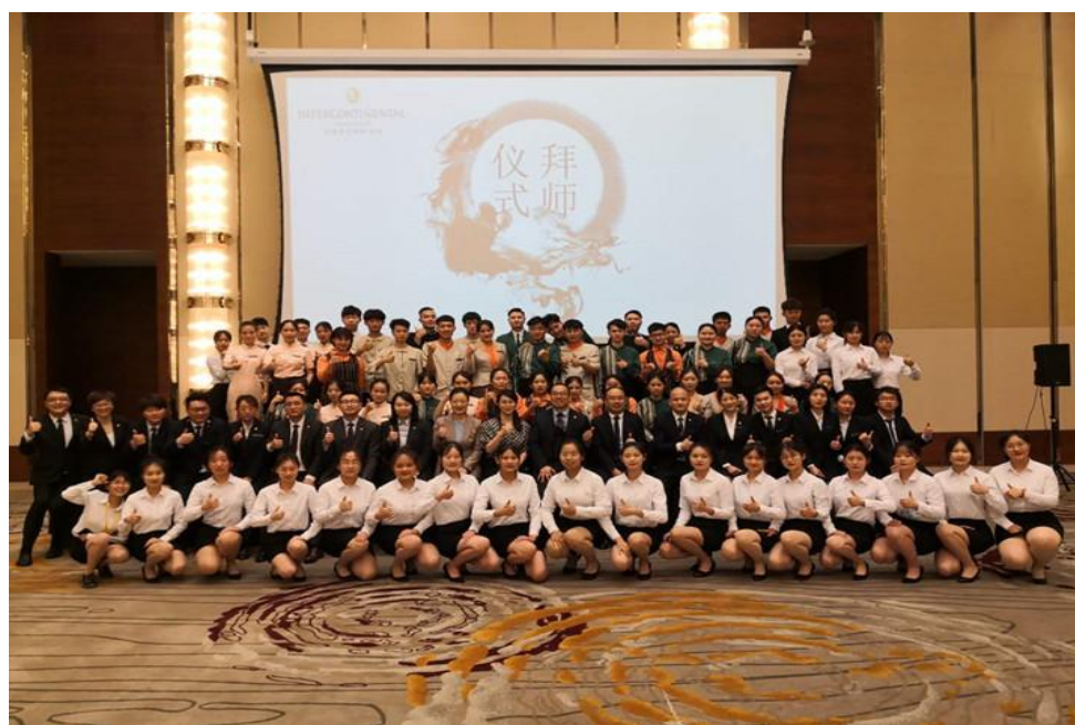
首届现代学徒制洲际英才班举行入职拜师仪式合影