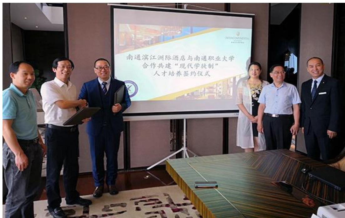
南通滨江洲际酒店与南通职业大学 “校企战略合作协议” 签字仪式现场

南通滨江洲际酒店于 2018 年 6 月与南通职业大学签订“南通洲际英才学徒班”战略合作协议，同年 9 月“南通洲际英才班学徒班”正式成立。2022 年是学徒班成立的第 4 个年头，已培养学生 88 名优秀毕业生。目前 2022 年 6 月首批学徒班 28 名学生已全部进入南通滨江洲际酒店进行跟岗实习，从实习情况反馈来看，大部分学生都具有较扎实的酒店服务操作技能且岗位适应性很强。