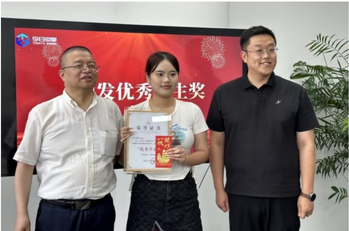
图 5：企业为优秀实习生颁发奖学金

校企双方自今年开展合作以来，在产教融合育人方面取得了突出的业绩，4月，双方达成协议共建工信部数字技术应用专精特新产业学院，项目于南通开发区智慧之眼园区成功落地并实体化运作。6月份开始，企业成功承担了22级电子商务专业、跨境电子商务专业80多位同学的实训实习任务，并向优秀实习生发放奖学金。7-8月间，企业接纳了学院教师下企业实习实践，帮助教师顺利完成实践任务。10月，公司作为经管学院电子商务专业产教融合实训基地，圆满接待了省高校产教融合专项督导组对学校的现场督查工作。校企双方取得的产教融合工作成果获得省督导组现场督察人员的高度肯定，有力的配合了学校工作，助推电子商务专业人才培养工作在省内打响品牌知名度。