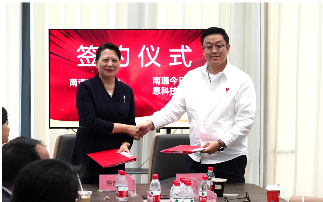
图 1：专精特新产业学院签约仪式

现优异。学生不仅技能增强，职业规划明确，还通过丰富的就业渠道实现精准对接。教改方面，深度融合产业需求，强化双师型师资，完善评价体系。经过一年的深度合作，校企共建产教融合实践基地，成效显著，荣获南通市崇川区人力资源和社会保障局颁发的“高技能人才公共实训基地”荣誉，成为南通市技能人才培养的新高地。