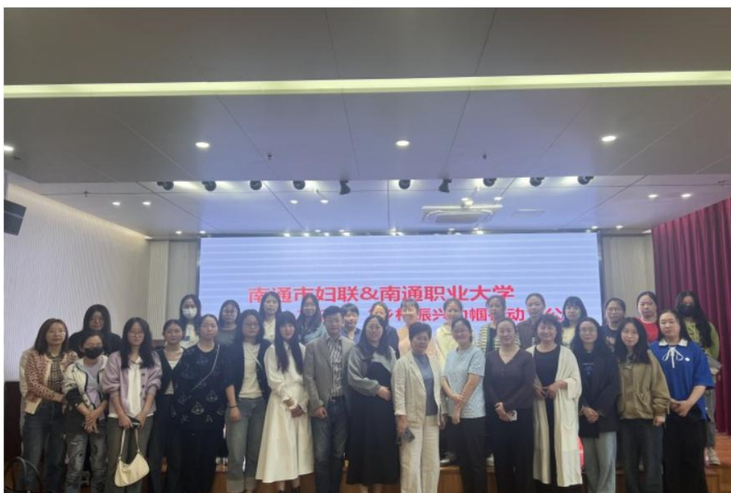
图 6：乡村振兴巾帼行动现场合影

继续教育，提升企业员工技能水平。学院也派驻教师利用暑期到实训基地进行岗位实践，提高教师的实践技能水平。除此以外，基地还积极拓展社会服务功能，校企双方共同开发面向社会公众的培训服务项目，如电子商务师、互联网营销师、茶艺、调酒等等，不仅能够帮助有需求的社会人员提升专业技能，产生的收益除用于维持实训基地日常运转外，校企双方按照协议约定比例进行分配共享，目前已经成功举办了茶艺、调酒等项目的社会培训。基地还热心服务公益，2024年10月，与南通市妇联一起在海门区三厂街道厂南村成功举办了2024“乡村振兴巾帼行动”公益赋能讲座——“数字经济新业态新技能电商直播、自媒体短视频制作”专场，旨在通过对村干部及乡村产业带头人的乡村振兴培训，有效推动数字电商与乡村产业融合，为乡村振兴赋能，取得了良好社会反响。