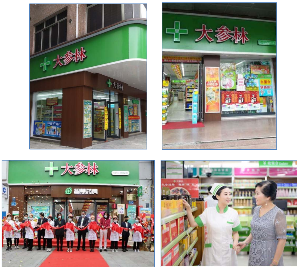
图 3 共建实训基地

在服务学校的同时，也实现了校企双赢。依托南通职业大学的国家级化工职业技能鉴定站，充分利用药品与环境工程学院的人才优势、资源优势，搭建广泛的社会服务平台。积极为企业开展企业员工的技能提升培训；加强职业技能鉴定与资格认证能力建设，拓展职业技能资格的辐射范围。