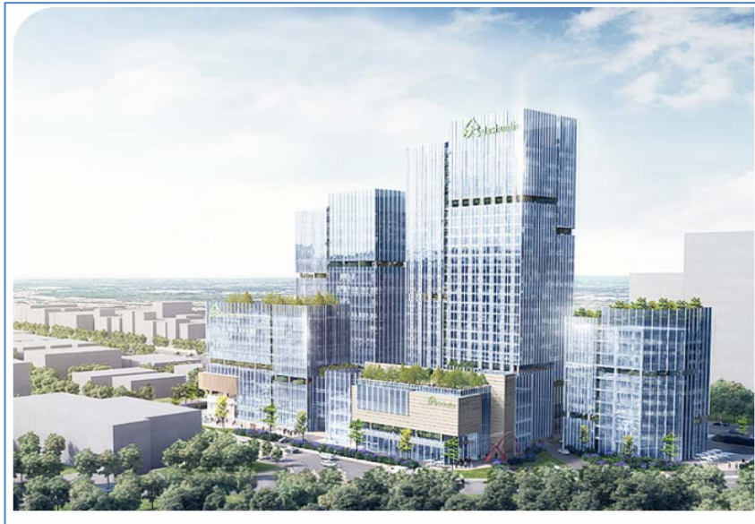
图 1 大参林医药集团股份有限公司