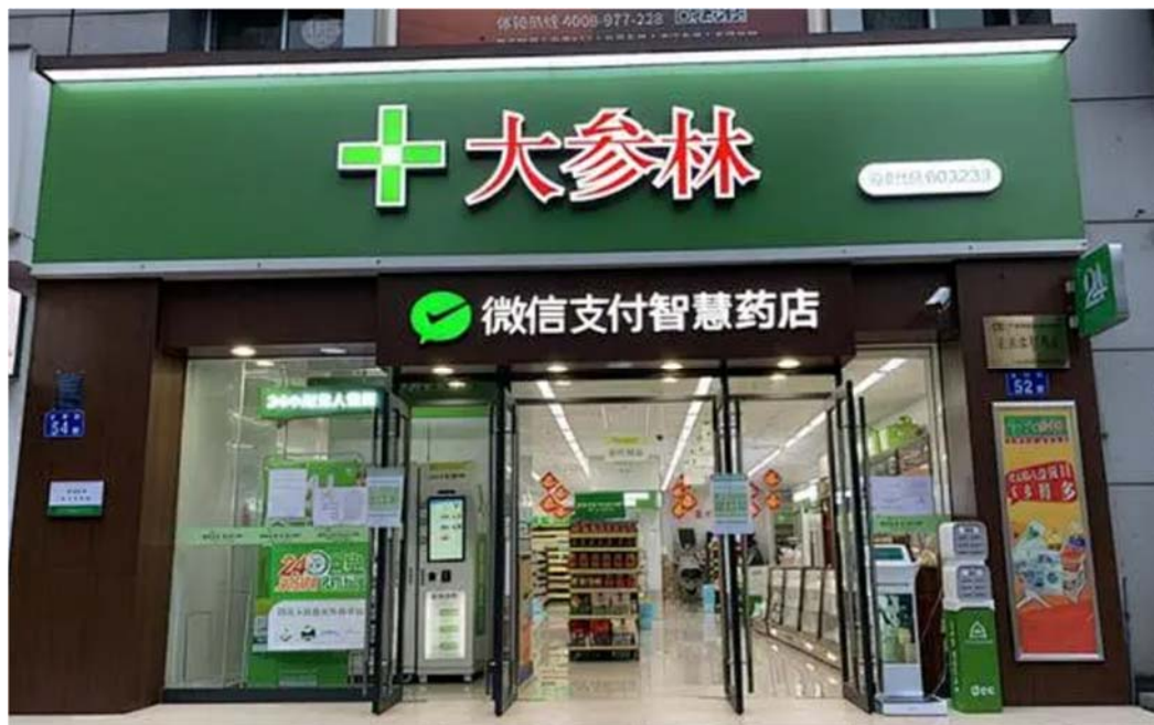
图 2 南通市大参林大药房