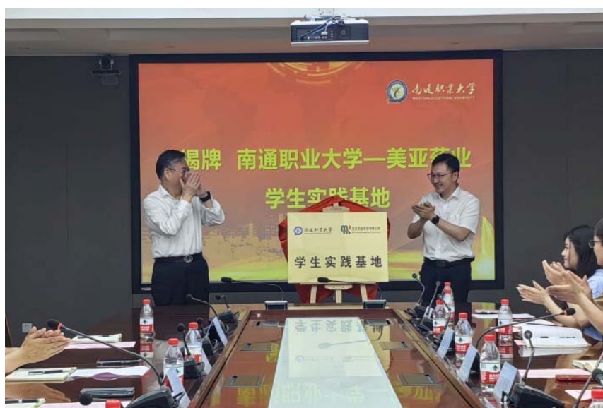
图 1 南通职业大学-美亚药业现代学徒制班开班典礼

美亚药业有限公司的研发总部在杭州，销售部在上海，生产部在南通海安，公司主要生产核苷酸，生产量近全国 50%，公司正处于高速发展阶段，急需各种层次的人才。此次学徒制班级的组建，为公司提供了人才储备，为公司的发展提供了保障。目前，公司已经为首批“美亚”学徒制班学员配备了高水平的企业导师，希望同学们以此为契机，刻苦学习，掌握技能，成为美亚的骨干员工。