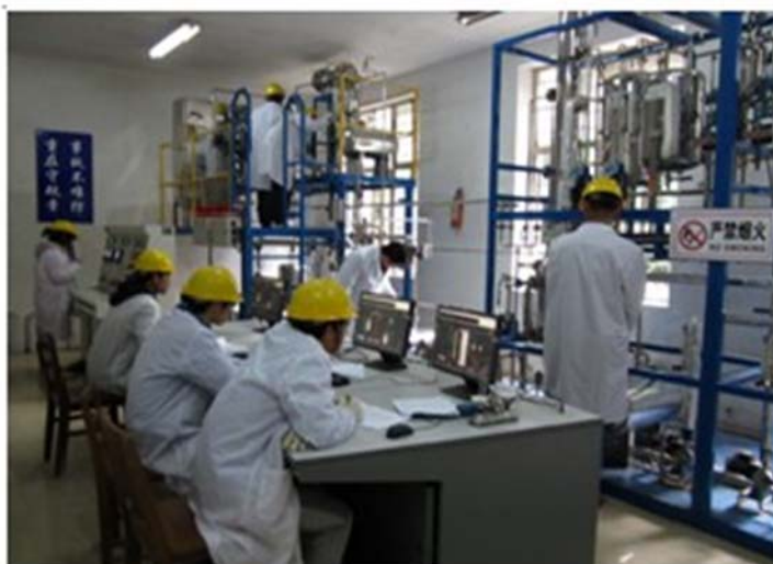
图 1 共建实训基地

在服务学校的同时，也实现了校企双赢。依托南通职业大学的国家级化工职业技能鉴定站的培训和考核资源，充分利用药品与环境工程学院的人才优势、资源优势，搭建宽广的社会服务平台。积极与企业开展企业员工和学校专任教师的互访互学，双方的理论和技能都得到了提升。